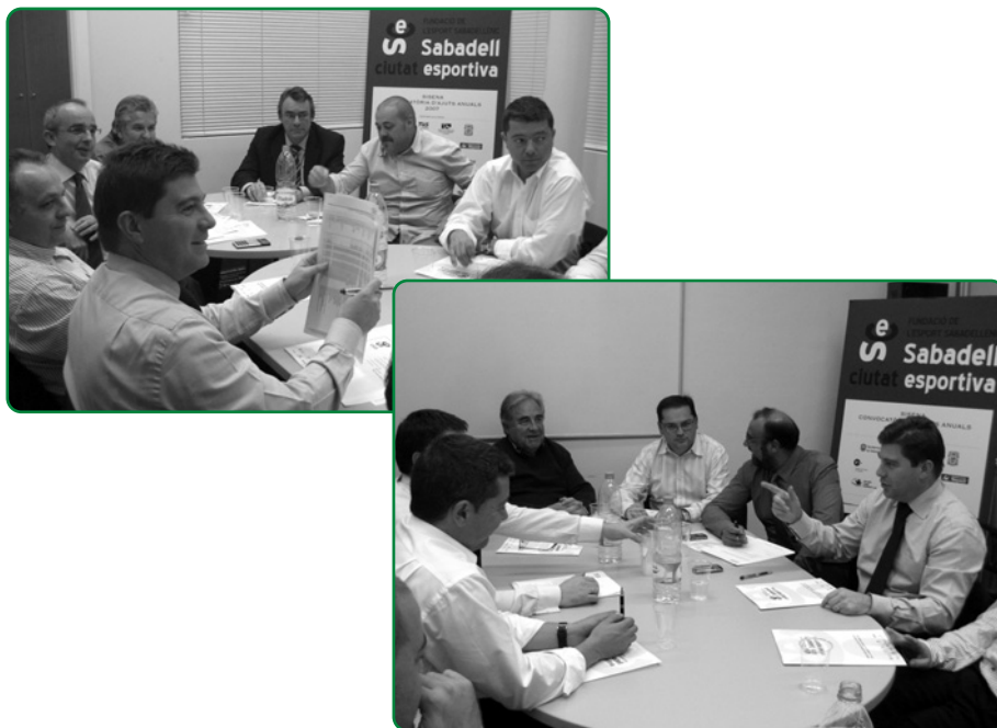
El Patronat de la Fundació reunint en Junta Extraordinària el passat 27 de novembre

La Fundació des de la seva primera convocatòria haurà fet lliurament de 1.172.833 euros en ajuts a projectes d'àmbit d'esport escolar, de base, de lleure, de competició, d'integració, de difusió, d'esport adaptat i esport d'elit d'entitats esportives i esportistes de la nostra ciutat. El Comitè Esportiu de la Fundació de l'Esport Sabadellenc, després de valorar els projectes lliurats pels diferents esportistes i entitats esportives, va passar les diferents propostes i avaluacions al Comitè Executiu, el qual va decidir els guanyadors dels ajuts, i l'Assemblea celebrada el 27 de novembre de 2008, els va aprovar amb posterioritat.