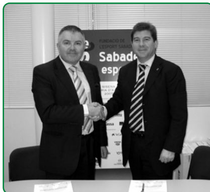
Signatura col·laboració Mondo Ibérica