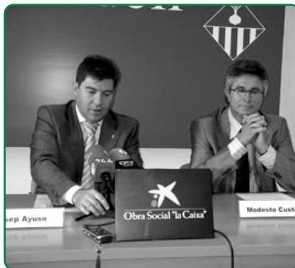
Signatura col·laboració La Caixa

Viu l'esport d'una manera diferent... col·labora amb la Fundació de l'Esport Sabadellenc.