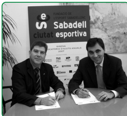
Signatura col·laboració IDP